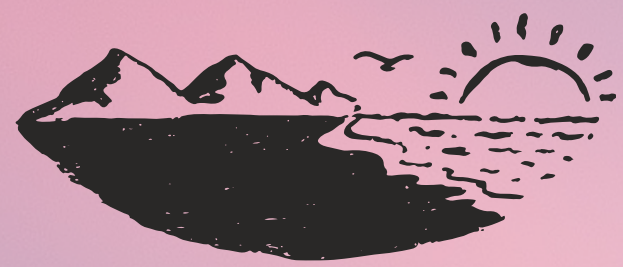
Gran plano general (GPG)

En la fotografía se utiliza con las imágenes de paisajes como ejemplo más claro y en el cine puede ser cualquier escena en la que no aparecen personajes o en su defecto.