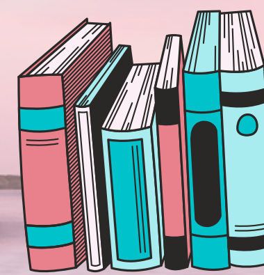
Plano detalle (PD)

Las personas involucradas en la escena cuentan con más protagonismo, puesto que el corte se efectúa, en general (puede ser su rostro, por la cintura o hasta cuerpo completo, dependiendo).