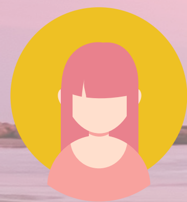
Plano medio (PM)

Las personas involucradas en la escena cuentan con más protagonismo, puesto que el corte se efectúa, en general (puede ser su rostro, por la cintura o hasta cuerpo completo, dependiendo).