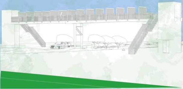
IMAGEN DE PROPUESTA

DEBIDO AL CRECIMIENTO AUTOMOVILISTICO EXPONENCIAL, SE HA OPTADO EN DAR UNA SOLUCION ARQUITECTONICA VIABLE AL PEATON PARA TRANSITAR SOBRE SUS LUGARES MAS RECURRENTES.