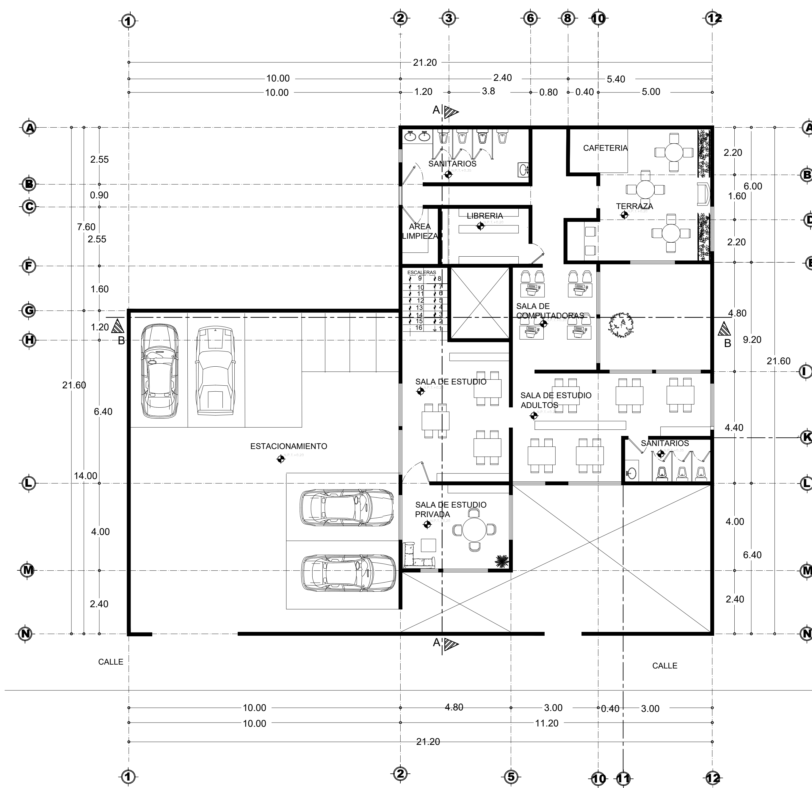
PLANTA ARQUITECTONICA ALTA ESC.....1.100