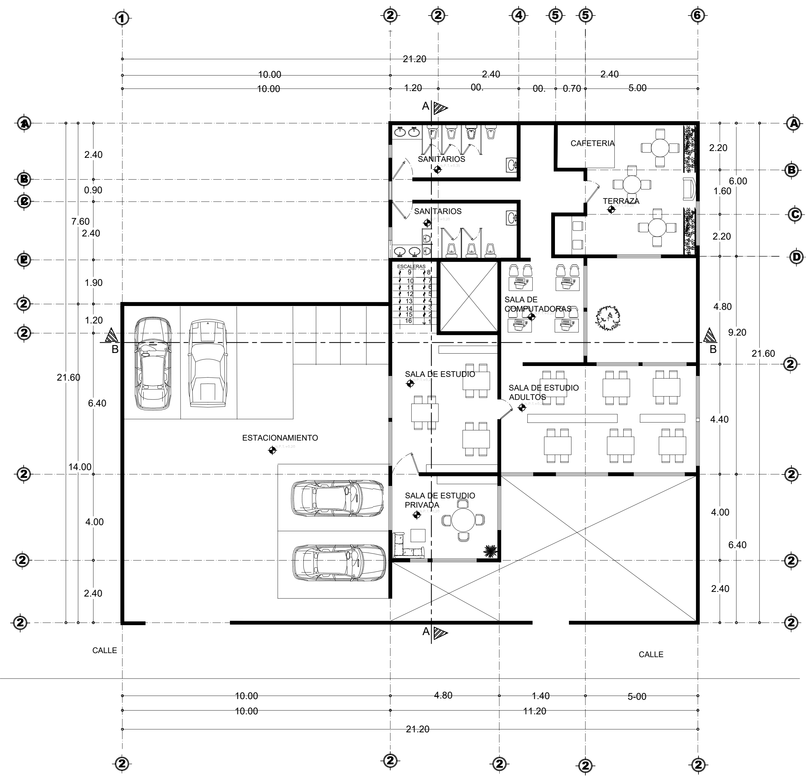
PLANTA ARQUITECTONICA ALTA ESC.....1.100