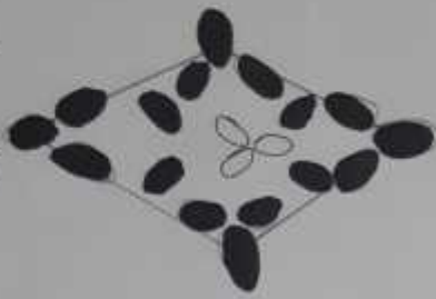
Disposicion de rombo.