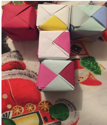
Pieza 3, o "T"