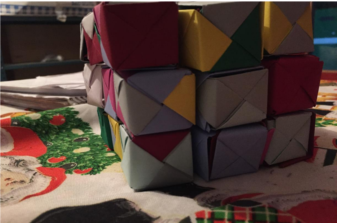
Cubo de 3x3x3 piezas figura(001)