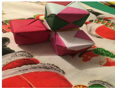
pieza 7, o "p"