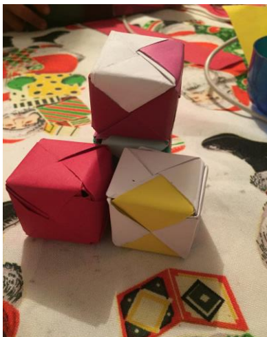
pieza 5, o "A"