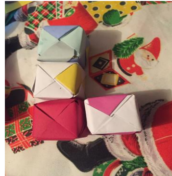
pieza 2, o "L"