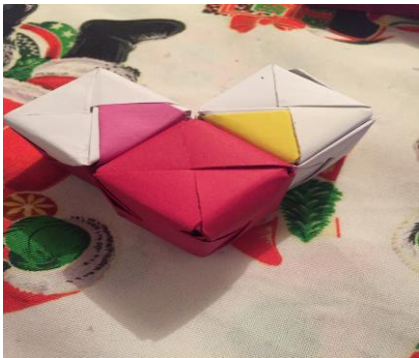
Pieza 1, o "v"

7 de las 7 piezas pegadas y decoradas según la tendencia (anexo A)