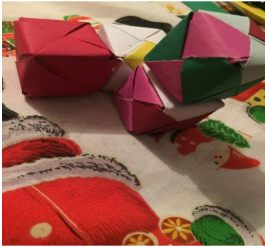
Pieza 6, o "B."