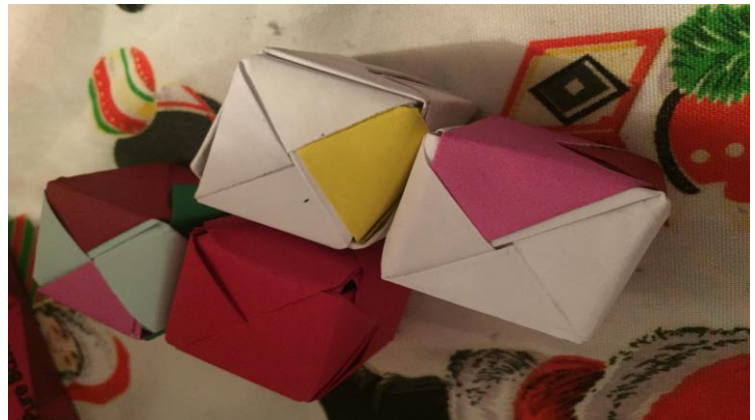
pieza 4, o "Z"