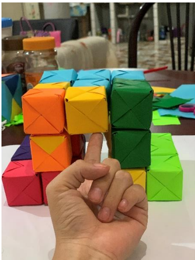
6.- FIGURA 013