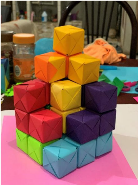
SE PARECE A LA PIRÁMIDE CHICHEN ITZÁ POR EL CUBO EN LA CÚSPIDE.