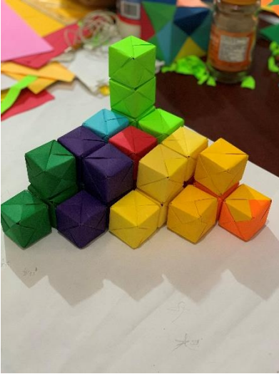
SEMEJANZA A UNA FUENTE