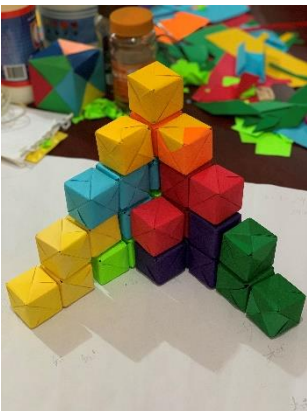
7.- FIGURA 015