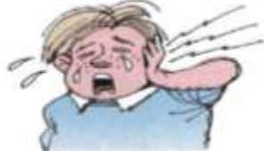
3. an earache