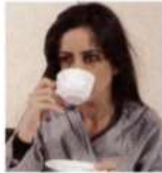
3. have some tea