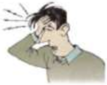
1. a headache