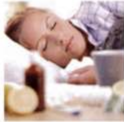
2. lie down