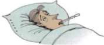
8. a fever