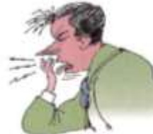
9. a cough