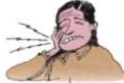
4. a toothache