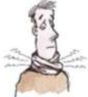
7. a sore throat