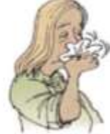
10. a runny nose

Exercise 2. Translate to Spanish the vocabulary above. Traduce al español el vocabulario de arriba.