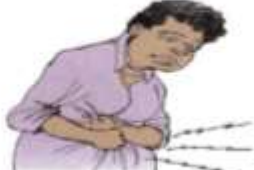
2. a stomachache