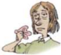
6. a cold