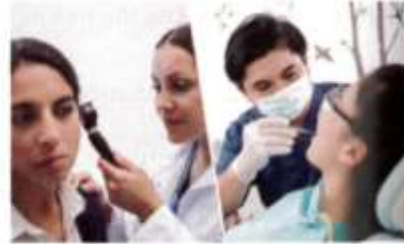
4. see a doctor/ see a dentist