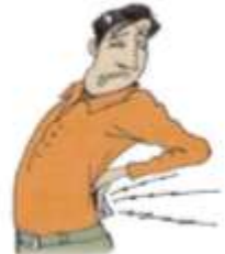
5. a backache