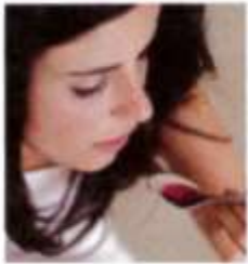
1. take something