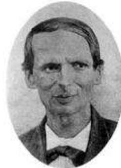
Dr. Luis Hidalgo y Carpio

Dr. Don Luis Hidalgo y Carpio, Fundador de la etapa científica de la medicina legal: Clasificación Médico-legal.