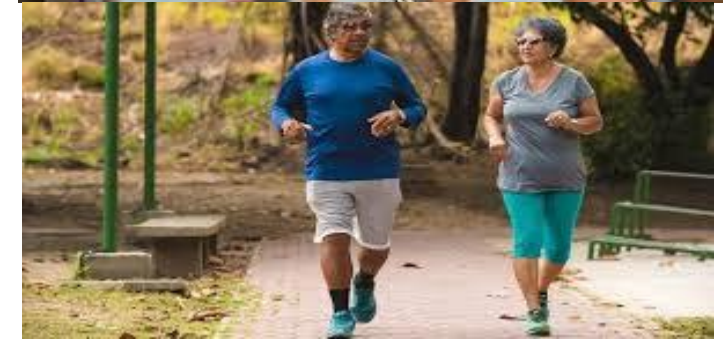
Sk'an sobtik jnikes jbek'taltik