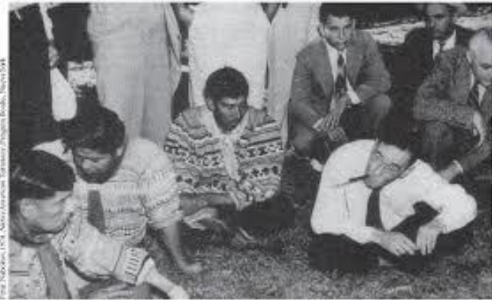
El cartógrafo John Collier en conferencia con líderes de la tribu seminole en Florida, 1905.

La antropología replantea su objeto de estudio y su relación con el mismo y comenzó a moldearse hacia estudios de ciencias.