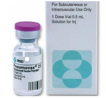
12. polisacárido contra neumococo