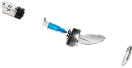
4. antipoliomielítica inactivada y con vacuna conjugada de haemophilus