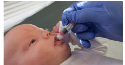
5.influenzae tipo b