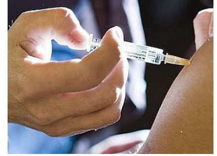
3. heptavalente de contra neumococo