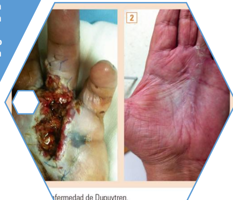
enfermedad de Dupuytren.

factores que influyen en la cicatrización: la cicatrizacion de la herida conyeva factores principalmente el tipo de herida que es si es una herida abrasiva(raspon) no conyeva mucho tiempo ni cuidados para su recuperacion en cambio si es una abulsiva conlleva un ghran trabajo puesto que de estas ay que limpiar y tener cierto tratamiento para su recuperacion