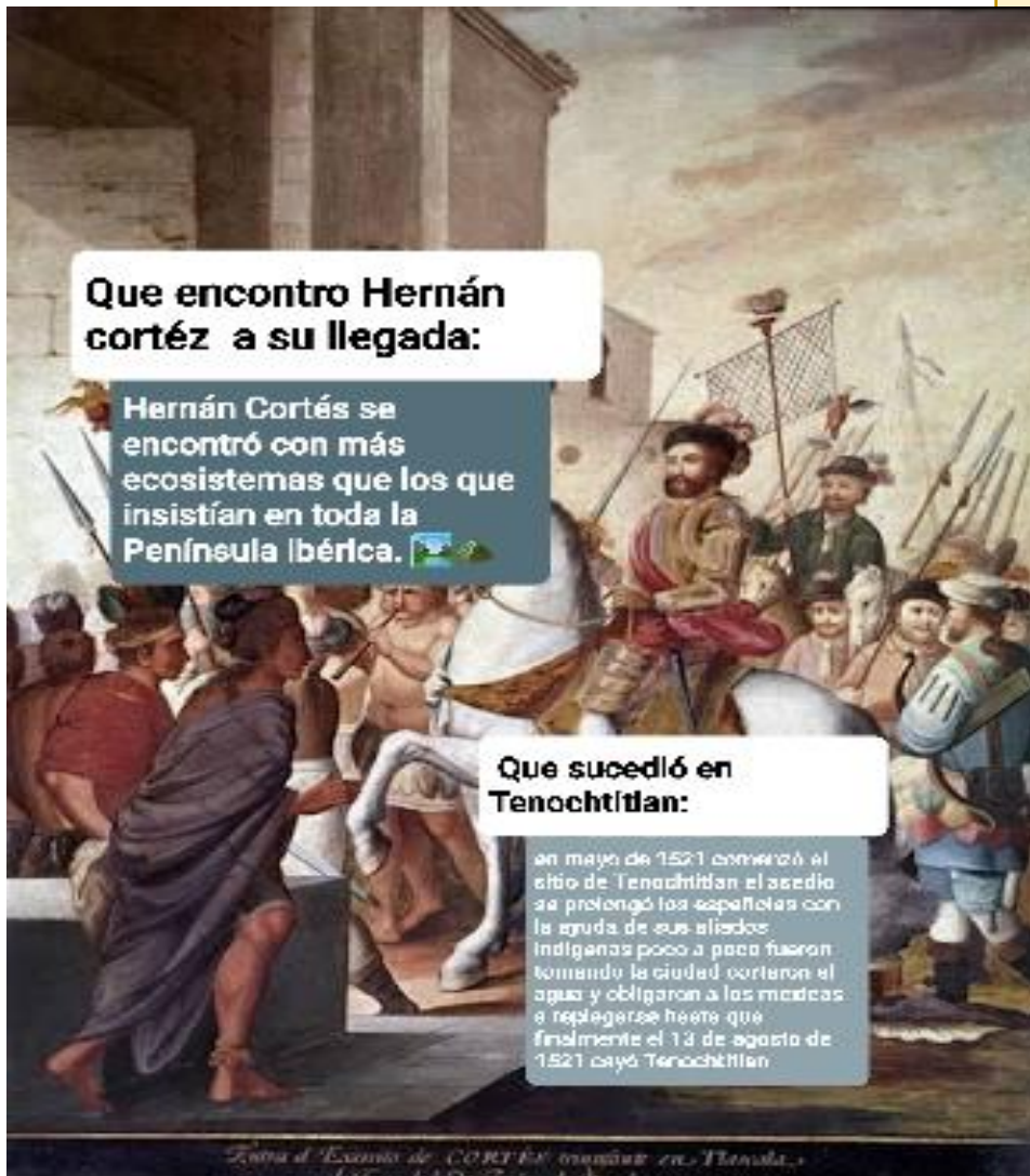
Batalla de Axayacatl de CORTÉS triunfante en Tenochtitlan

en mayo de 1521 comenzó el sitio de Tenochtitlan el asedio se prolongó los españoles con la ayuda de sus aliados indígenas poco a poco fueron tomando la ciudad cortaron el agua y obligaron a los mexicas a replegarse hasta que finalmente el 13 de agosto de 1521 cayó Tenochtitlan