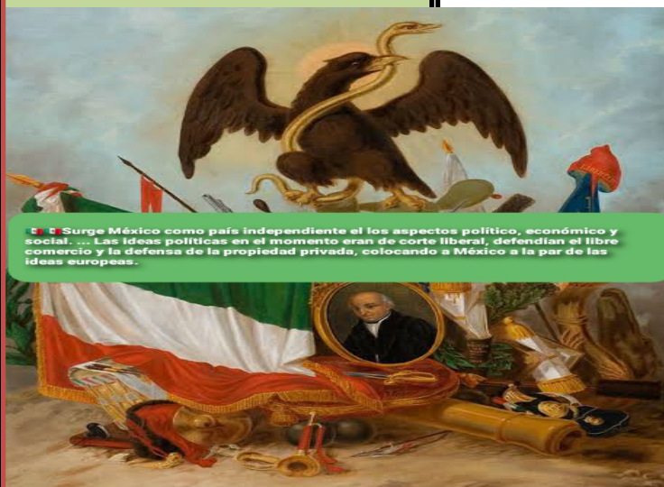
El Surge México como país independiente el los aspectos político, económico y social. ... Las ideas políticas en el momento eran de corte liberal, defendían el libre comercio y la defensa de la propiedad privada, colocando a México a la par de las ideas europeas.

La independencia de México fue una lucha armada con confrontación de ideas la necesidad de darle a México nos buscamos nueve idea las alianzas entre criollos y peninsulares el arribo de Agustín de Inturbide político-militar el primer emperador de México la participación de lógicas masónicas la pugnas entre liberales y conservadores entre los elementos son fundamentales durante el periodo y determinantes dentro de la separación la del México independiente que todos anhelaban después al final finalizar la independencia México debería surgir de las cenizasorio había dejado de ser una columna quería una nueva fisionomía la del Estado nación esto implica que se convirtiera en un territorio soberano con una delimitación definida habitando Por ciudadanos que estaban bajo