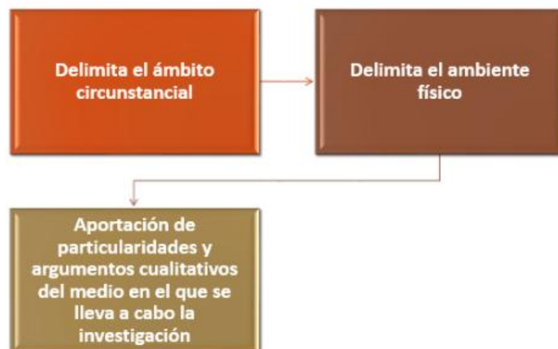
Figura 2: Marco contextual