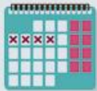
Calendario días fértiles