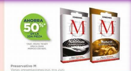
Preservativo M Varías presentaciones (90x2, 99x2, 132x2)