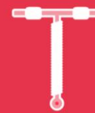
T de cobre