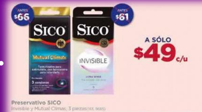
Preservativo SICO Invisible y Mutual Climax, 3 piezas (100, 100)

mayoría de las mujeres, las mejores son las más baratas