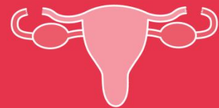
LIGADURA DE TROMPAS