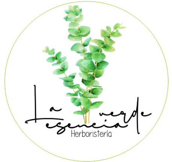
Ilustración 1 Logotipo "La esencia verde"

Eslongan: “Con un huerto y un malvar, hay medicinas para un lugar.”