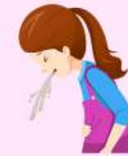
Náuseas y vomitos