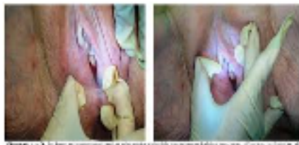
Figura 1 y 2. El primer caso muestra placas blancas parcheadas y fisuras en la vulva.