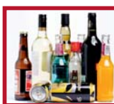
Abuso del alcohol