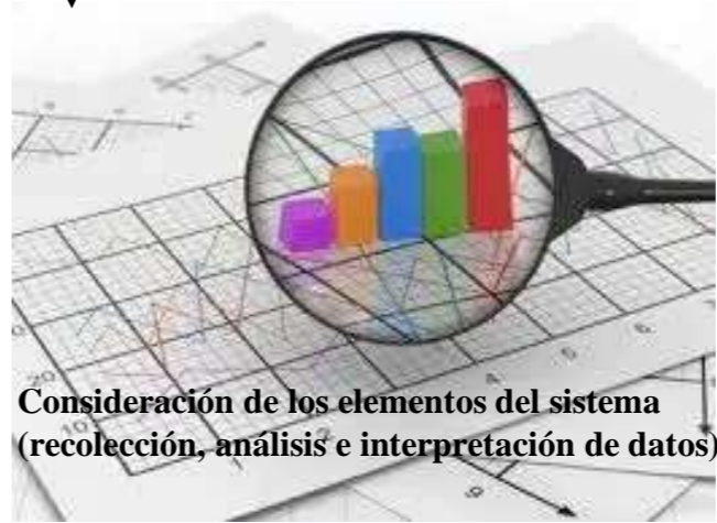
Consideración de los elementos del sistema (recolección, análisis e interpretación de datos).