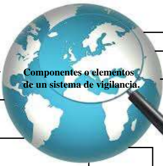
Componentes o elementos de un sistema de vigilancia.