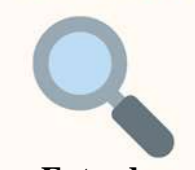
Entrada: recolección de datos.