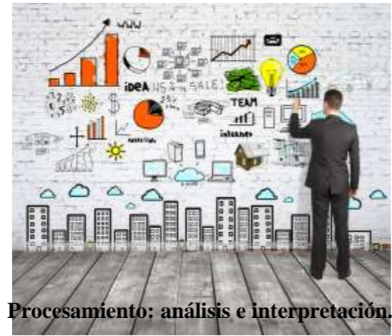
Procesamiento: análisis e interpretación.