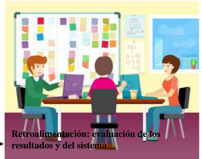
Retroalimentación: evaluación de los resultados y del sistema