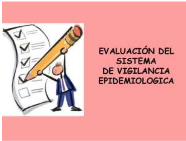
EVALUACIÓN DEL SISTEMA DE VIGILANCIA EPIDEMIOLOGICA