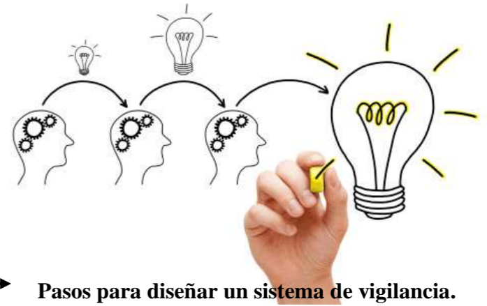
Pasos para diseñar un sistema de vigilancia.