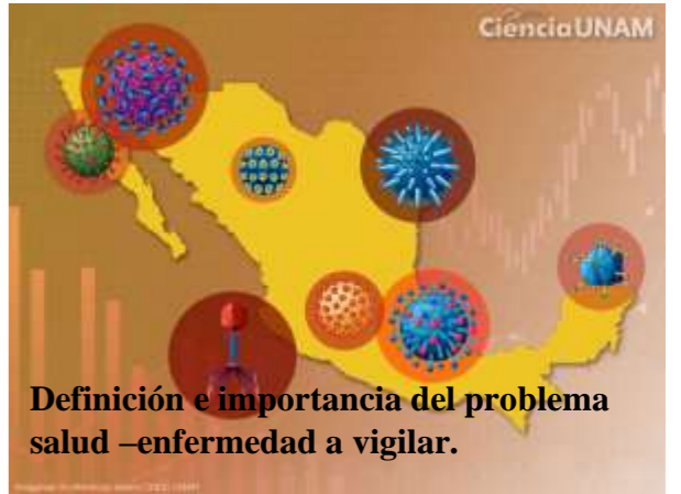
Definición e importancia del problema salud –enfermedad a vigilar.