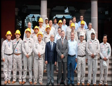
Centro Nacional de Programas Preventivos y Control de Enfermedades