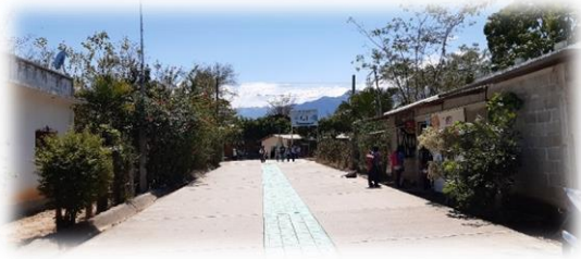
VISTA DE LAS CALLES PAVIMENTADAS