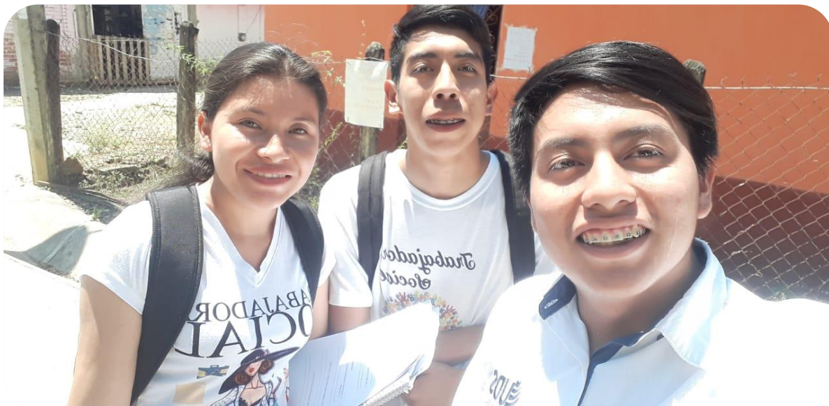
Equipo de Licenciados en Trabajo Social.

El equipo de la licenciatura en Trabajo Social y Gestión Comunitaria de la universidad del Sureste (UDS), realizamos una visita domiciliaria en la comunidad El Anonal municipio de frontera Comalapa Chiapas el día 18 de junio del año en curso, con la finalidad de realizar una práctica para así saber cuántas calles no están pavimentadas y poder gestionar para que se terminen esas obras , para lo cual llevamos a cabo un recorrido por la comunidad encuestando a las personas que allí viven, haciendo también observaciones a la comunidad para así poder gestionar el proyecto de las calles.