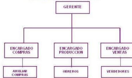
ESQUEMA DE ORGANIZACION LINEAL

Se caracteriza porque la autoridad se concentra en una sola persona quien toma las decisiones y tiene la responsabilidad básica del mando.