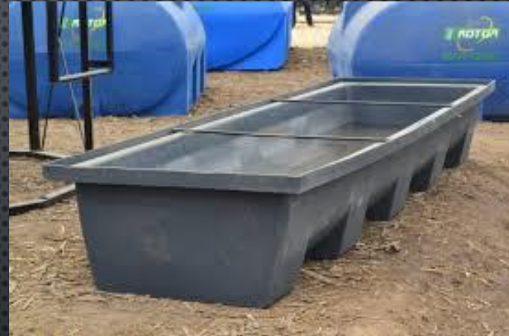
Bebederos 3 a 6 cm lineales por animal, a una altura de 40 a 50 cm