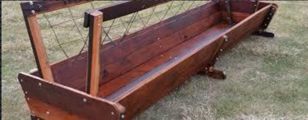
Comederos 45 a 55 cm lineales por animal