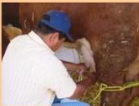
ORDENABILIDAD, CUALIDADES DE LA RAZA