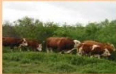
LIBIDO , PUBERTAD TEMPRANA Y FERTILIDAD