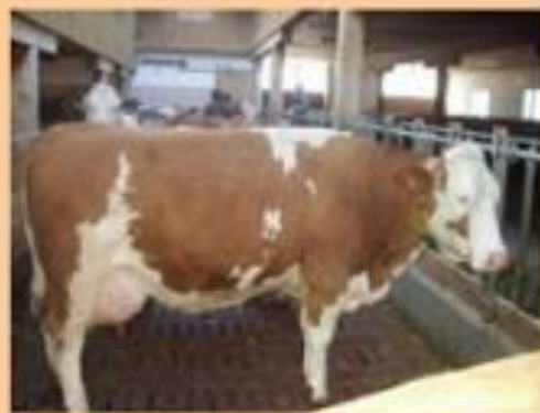
PRODUCCION DE LECHE