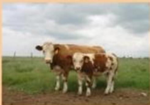
ALTOS PESOS AL DESTETE