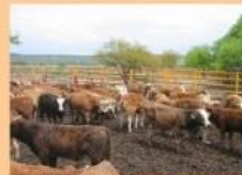
EN CORRAL DE ENGORDA DESEMPEÑO Y CALIDAD DE LA CARNE