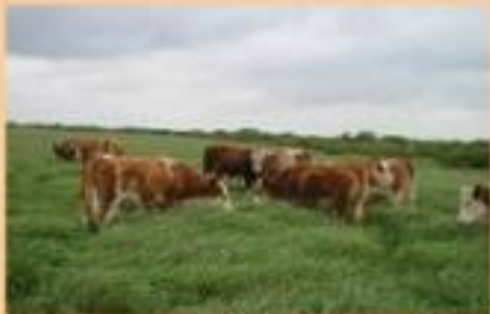
CONVERTIDORES DE FORRAJE