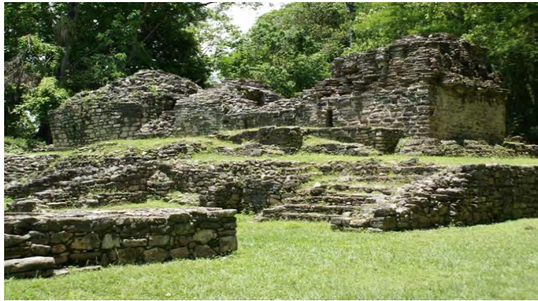
Y a x c h i l à n