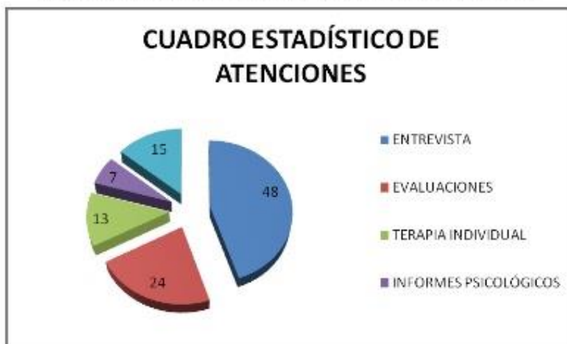
GRÁFICO N° 3 RESUMEN DE ACTIVIDADES REALIZADAS EN MARZO