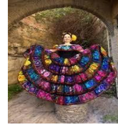
Riqueza de la flora local