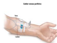
Catéter venoso periférico