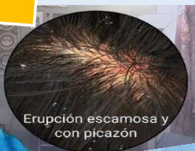
Erupción escamosa y con picazón