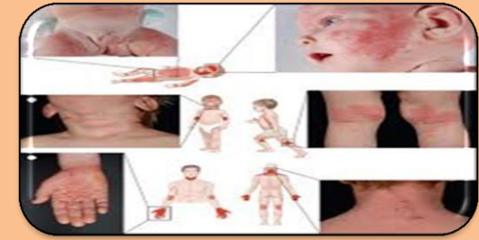
Tipos de dermatitis