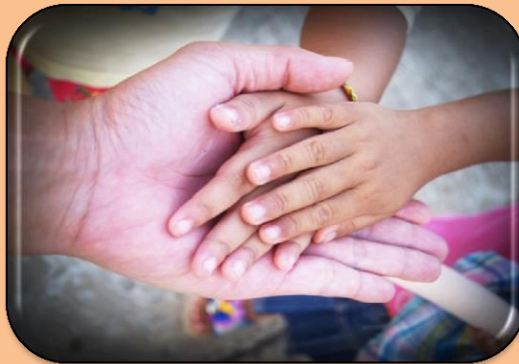
Factores de riesgo que pueden aumentar determinados tipos de dermatitis.