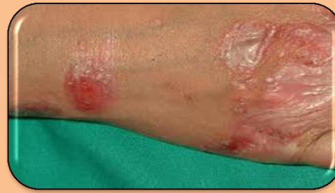
Sintomas: Erupción con comezón, enrojecimiento, inflamación, ampollas.