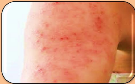
Dermatitis: Inflacion de la piel