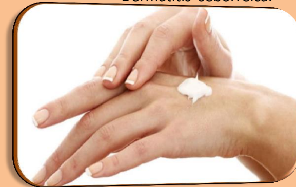
Prevención y tratamiento: Evitar piel seca, baños o duchas mas cortas con agua tibia, utilizar productos que no contengan fragancias, secarse con cuidado, humectar la piel.