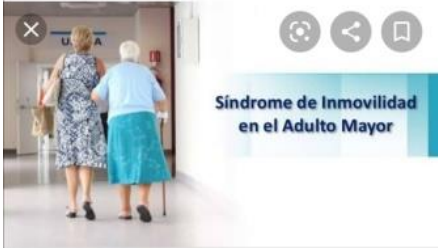
Síndrome de Inmovilidad en el Adulto Mayor