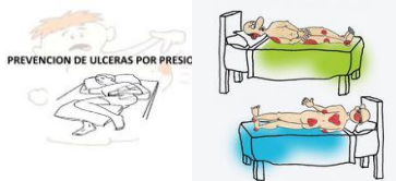
PREVENCIÓN DE ULCERAS POR PRESIC