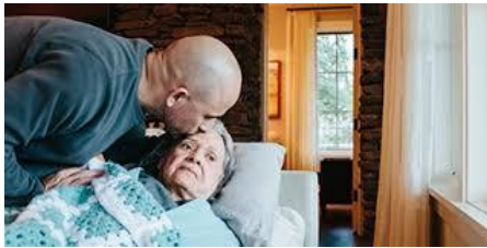
2ª Fase: Ira