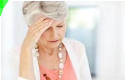
1ª Fase: Negación y Aislamiento