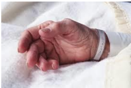
3ª Fase: Pacto