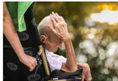
4ª Fase: Depresión