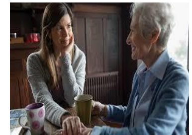
5ª Fase: Aceptación

Durante todas estas fases el único sentimiento común que siempre persiste es la esperanza.