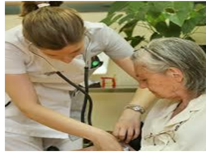
Diagnosticar una enfermedad incurable siempre es difícil.