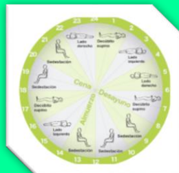
Reloj de cambios posturales