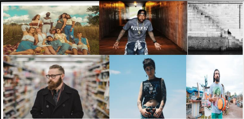
ALGUNAS TRIBUS URBANAS

XPor lo general, cada una de estas denominadas tribus tiene características que definen sus ideales y objetivos como lo son: