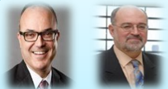
Casadesus-Masanell y Ricart

Establecen al modelo de negocio como elecciones y las agrupan en tres categorías