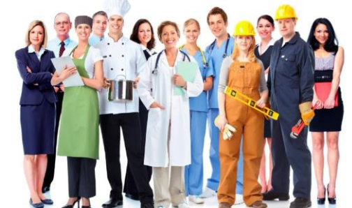
Libertad de trabajo