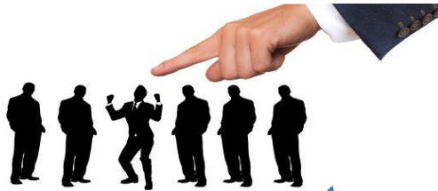
Función de selección