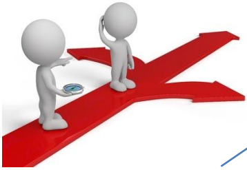
Función de orientación