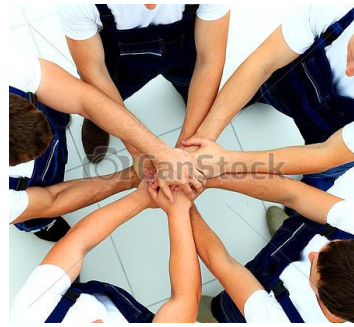
Función de unión