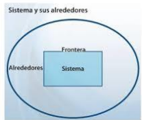
FIGURA 1-19 Sistema, alrededores y frontera