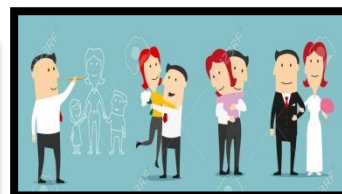
Formación de pareja