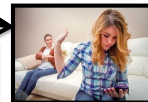
Familia con hijos adolescentes