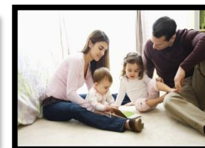
Familia con hijos pequeños