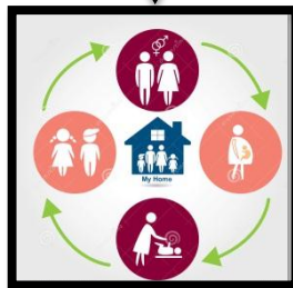
Desarrollo y cambio