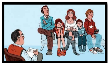
Métodos de formación