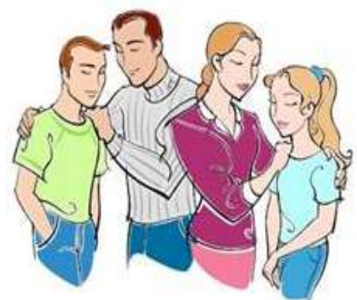
La familia con hijos de edad adolescentes