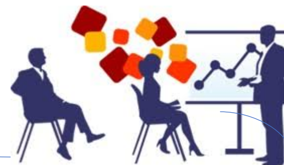
Métodos de formación