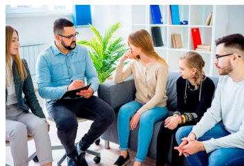
Espontaneidad, métodos y familia