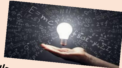
Formulación de hipótesis