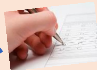
Recogida de datos