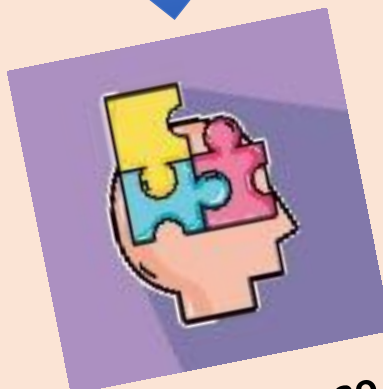
Análisis del caso