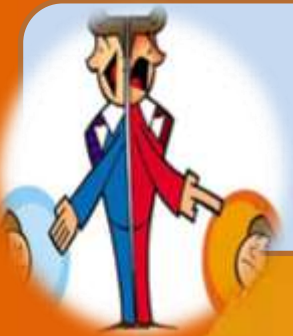
Figura de un líder carismático