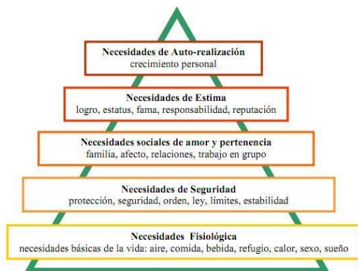
Figura 1. Adaptado de Chapman (2007).

Abraham Maslow fue quien propuso y fundó la teoría de la motivación humana, esta teoría está basada en una jerarquía de necesidades y factores con el fin de ayudar a las personas a ser motivadas, en este se mencionan cinco categorías en cuanto a las necesidades de cada persona.