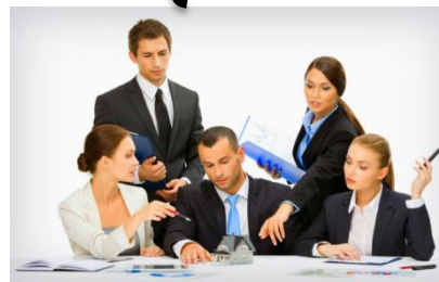
Liderazgo democrático hace participe a su equipo en la toma de decisiones.