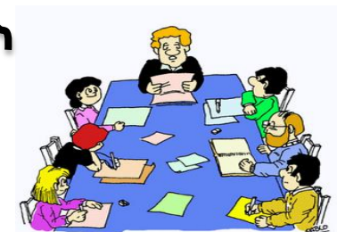
Liderazgo orientado a las personas y no a las tareas sirven como apoyo para guiar y organizar a los trabajadores.