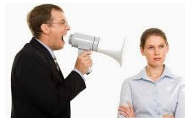
Autocrático poder absoluto sobre el equipo