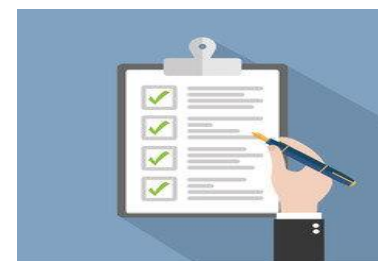
Liderazgo burocrático de rige por reglas y procedimientos