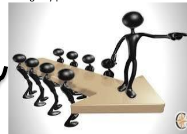
Liderazgo orientado a tareas son buenos organizando y asignando responsabilidades