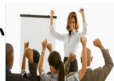
Liderazgo carismático creen mas en si mismo que en el equipo