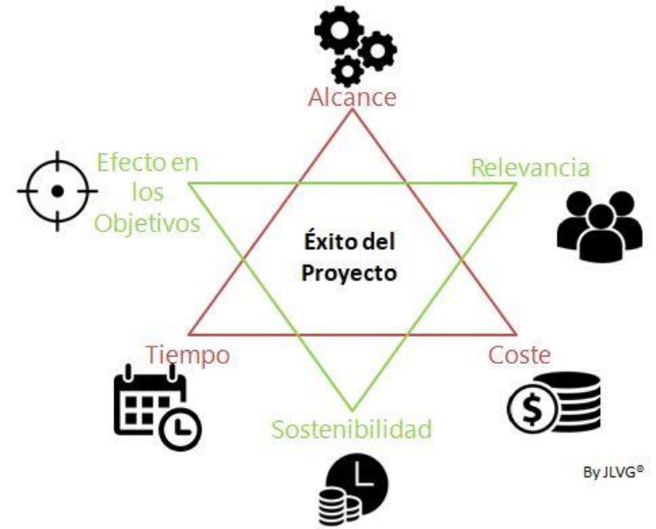
Elementos de un Proyecto