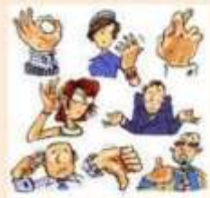
Comunicación No Verbal